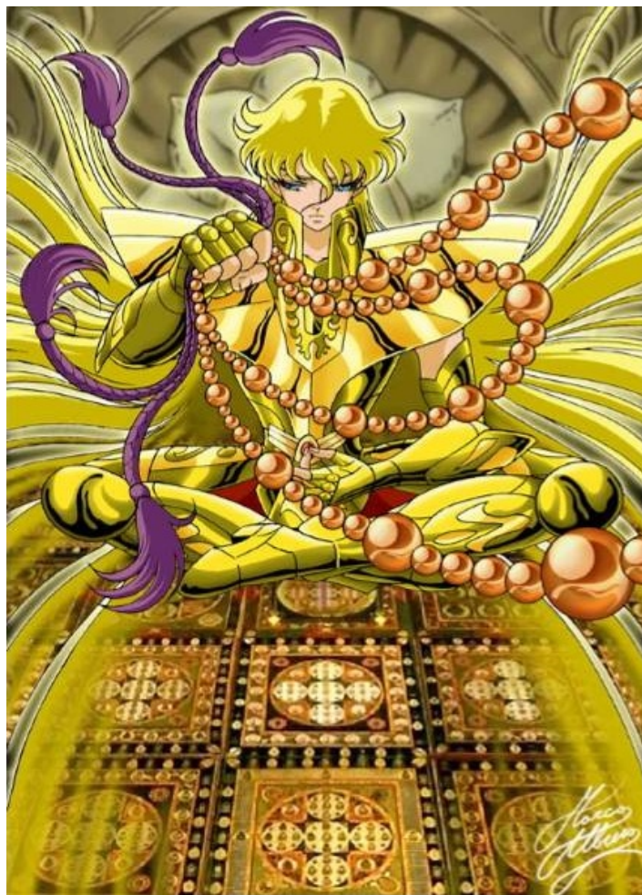
Illustration : Marco Albiero