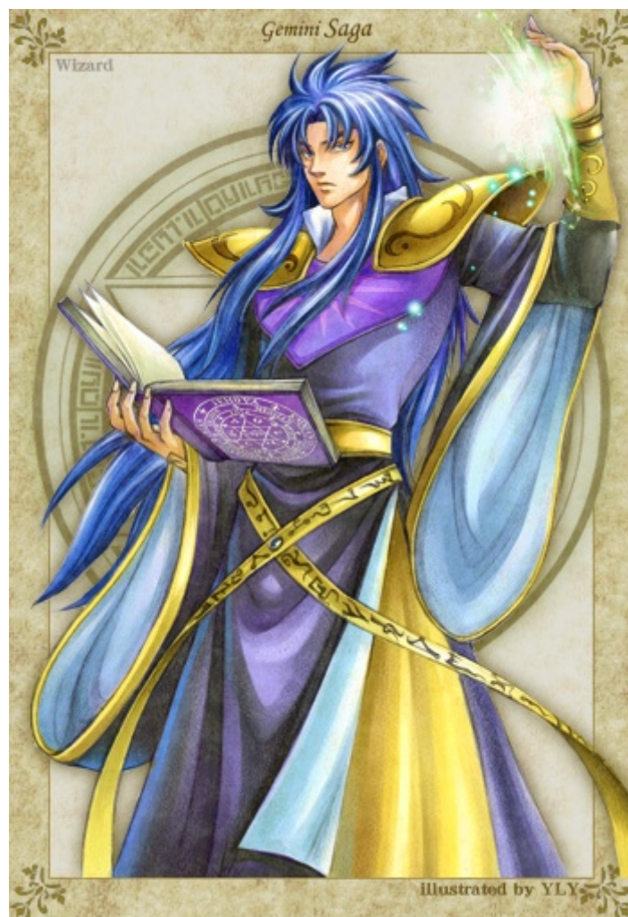
Illustration : YLY