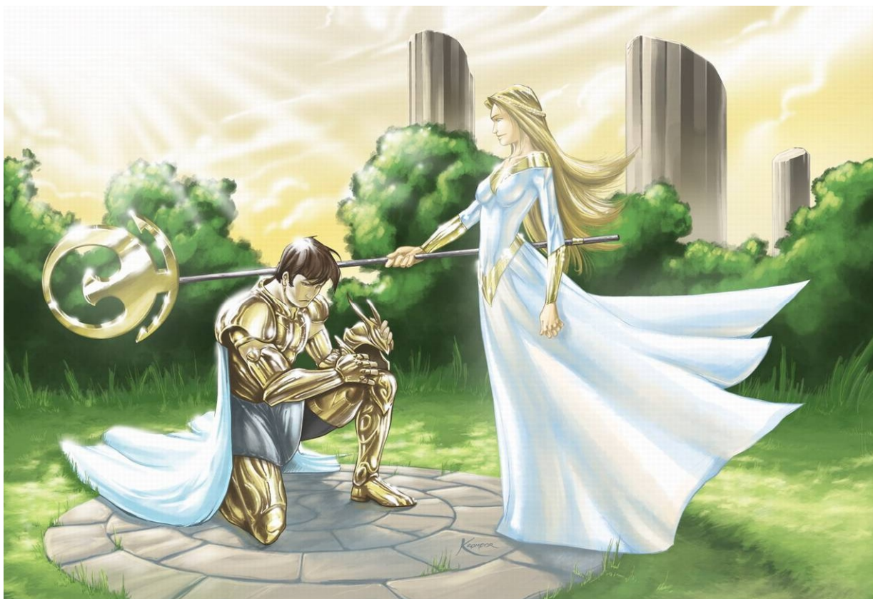
Illustration : Kromdor