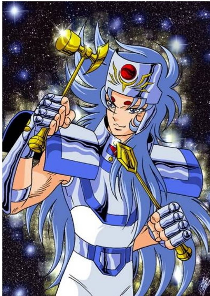
Illustration : Marco Albiero