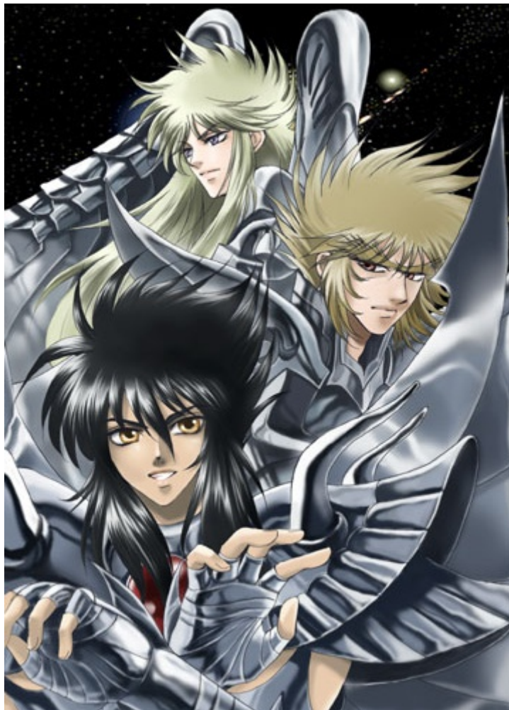
Illustration : Love Drop